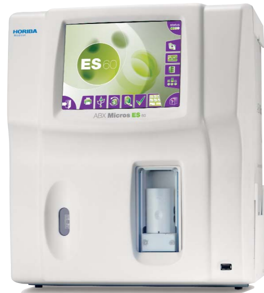
Versión tubo cerrado (Tubo abierto opcional)

Una nueva generación de analizador hematológico basado en el concepto Micros, universalmente reconocidos por su fiabilidad, robustez y alta calidad de resultados.